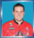
2008-09 PBA Player of the Year Wes Malott

PBA No.1ボウラーが選ぶ No.1シリーズ。 *CELL™* 2008-09 Ball of the Year