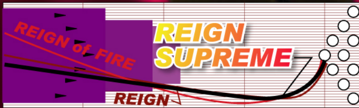
○レイン シュプリーム ▶ R2S Hybrid ●レイン▶ R2S Pearl ●レイン オフ ファイア ▶ R2S Solid