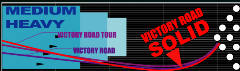
●ビクトリーロード ソリッド R2S SOLID ●ビクトリーロード R2S PEARL ●ビクトリーロード・ツアー R2S GEN4 SOLID

メーカー希望 小売価格 ¥40,950 (税込) 本体価格 ¥39,000 (税別)