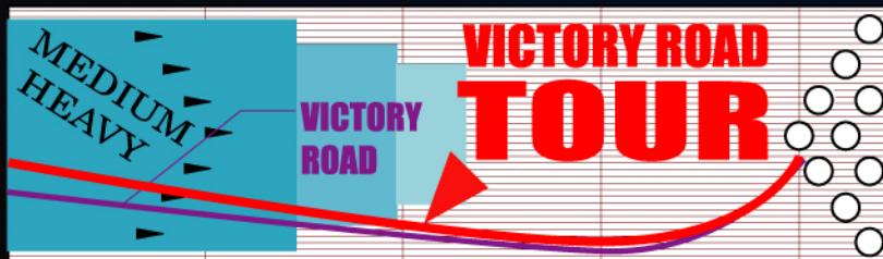
●ビクトリーロード R2S PEARL

メーカー希望 小売価格 ¥40,950 (税込) 本体価格 ¥39,000 (税別)