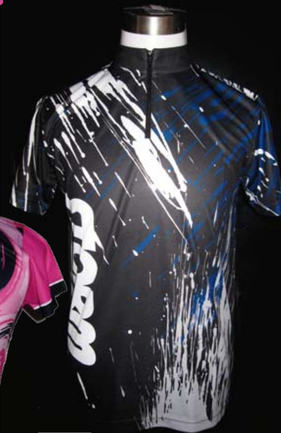
P8047-2 S5-002 STORM LOGO JERSEY