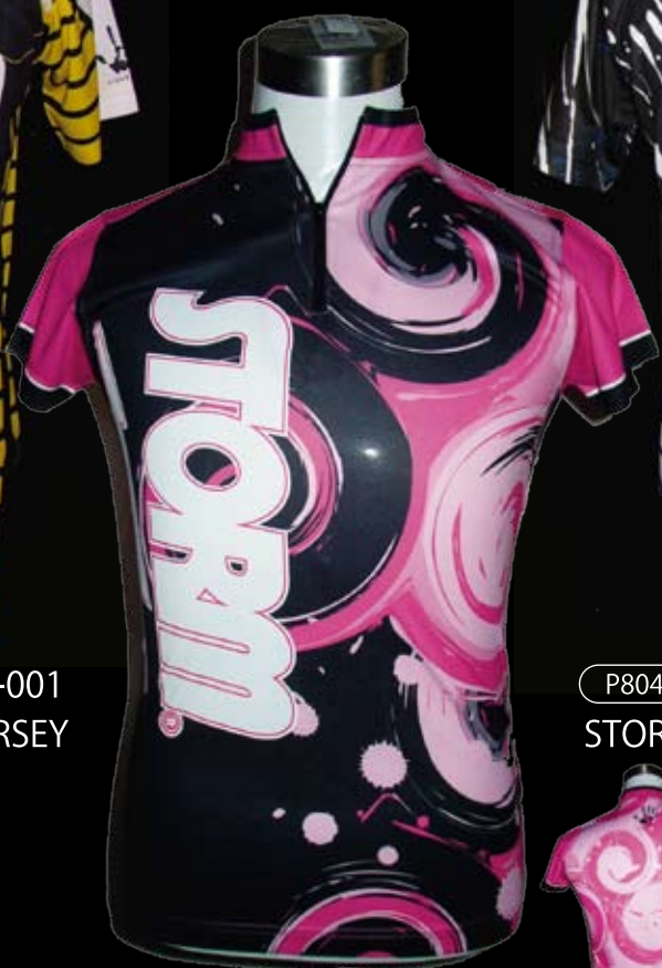
P8048 S5-501 STORM LOGO JERSEY Ladies