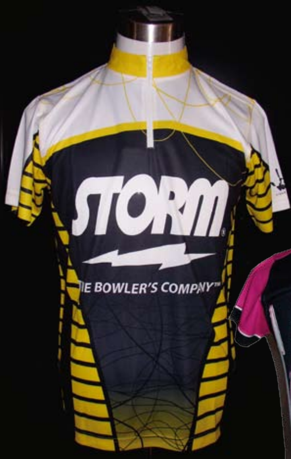
P8047-1 S5-001 STORM LOGO JERSEY