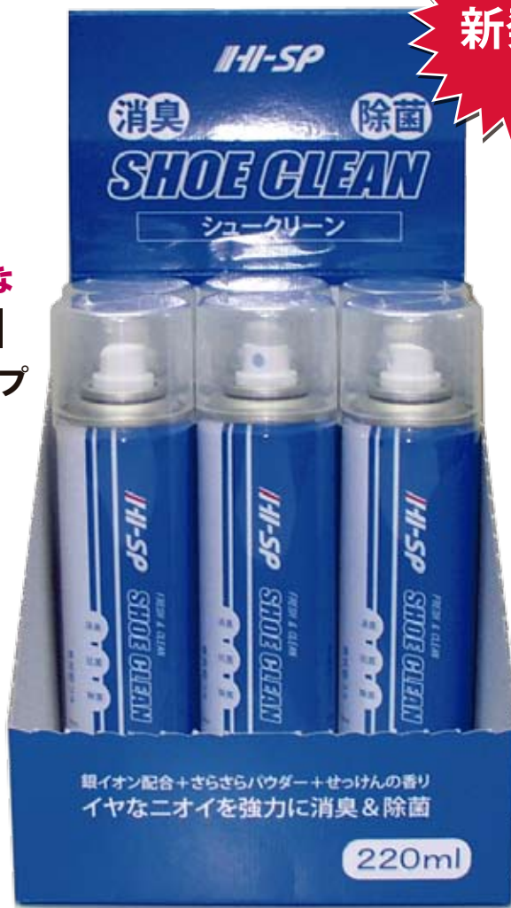
ディスプレイ箱入り (1箱12本入)