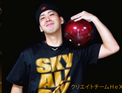
クリエイティブチームHeXa代表 スカイトモ

SKY-TOMO デザイン ストーム&HeXaコラボジャージ Die-Sublimation Print 第1弾!!!