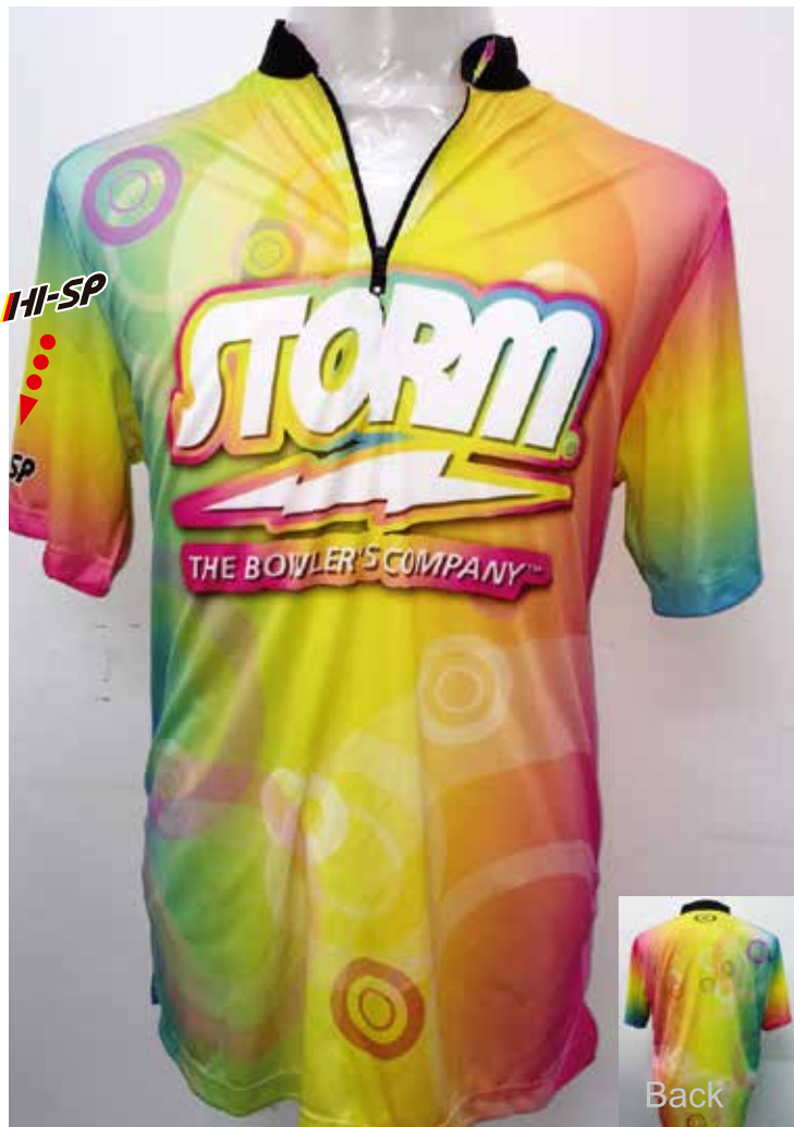
品番 P-8708 HS-01020 STレインボー