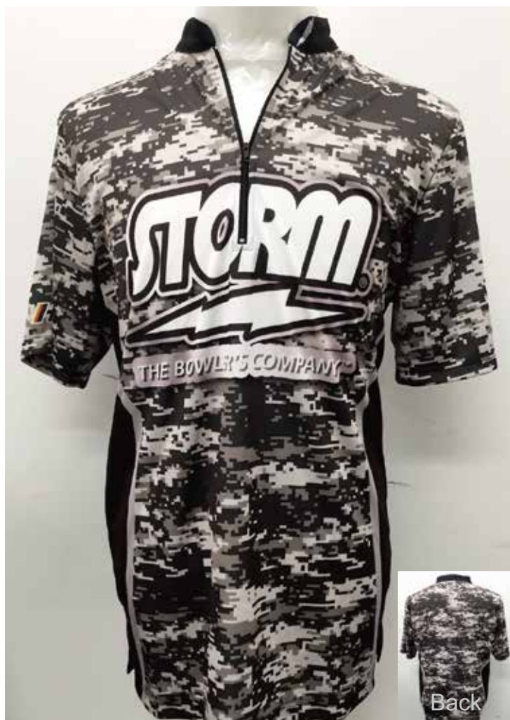
品番 P-8709 HS-01021 STジオメトリー(GY)