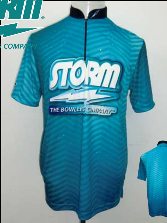
■ HS-01012 ストーム ジオメトリー (LB)