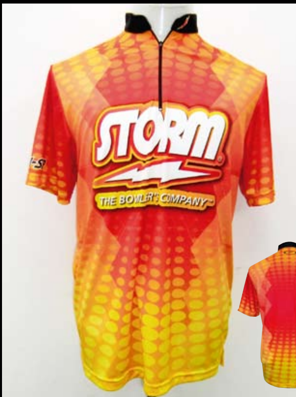
■ HS-01013 ストーム ジオメトリー (Y/R)