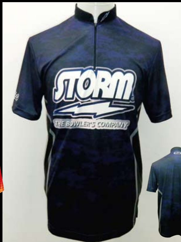
■ HS-01014 ストーム ジオメトリー (NV)

※右袖にHI-SPロゴマークもプリントされています。 Made in Philippines