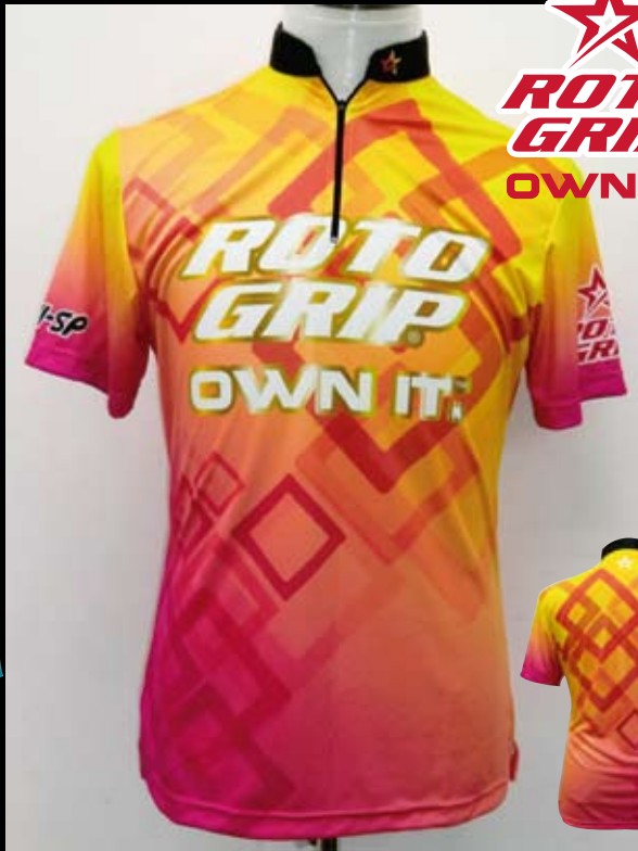
■ HS-01015 ロトグリップ ジオメトリー (Y/P)