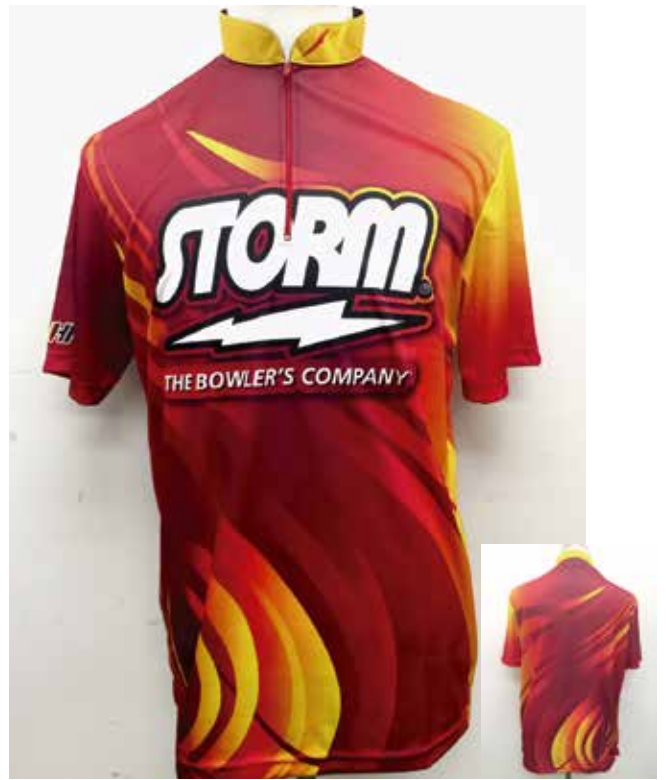
■ HS-01072 S Tジオメトリー (R)