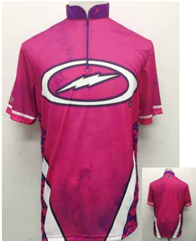
■ HS-01073 S Tジオメトリー (V)