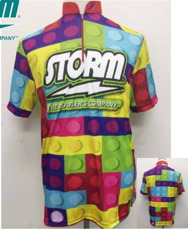
■ HS-01071 S Tブロック