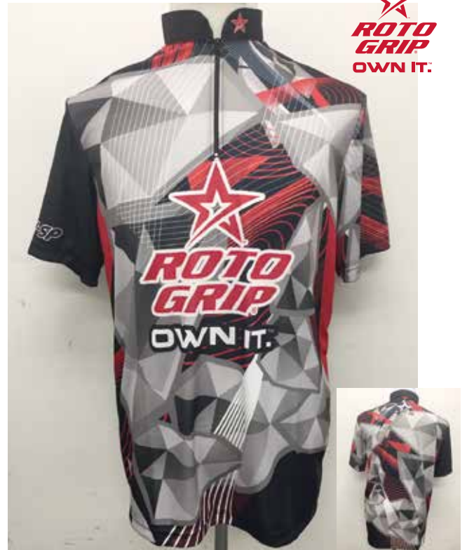
■ HS-01074 R Gジオメトリー (BK)

※右袖にHI-SPロゴマークもプリントされています。 Made in Philippines